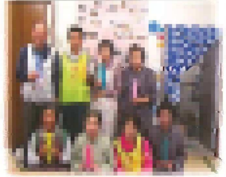
願いを込めて短冊作り