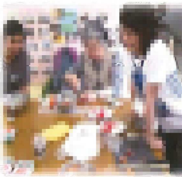
ヘルシーベジタブルゼリー