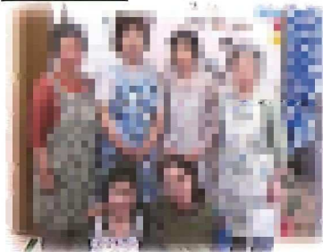
横浜からの手作りエプロン