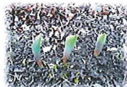
チューリップも大きくなってきました