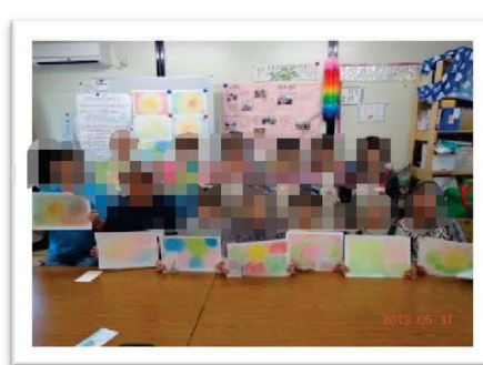
作品を手にハイ！チーズ♪