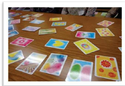
セラピーコミュニケーション