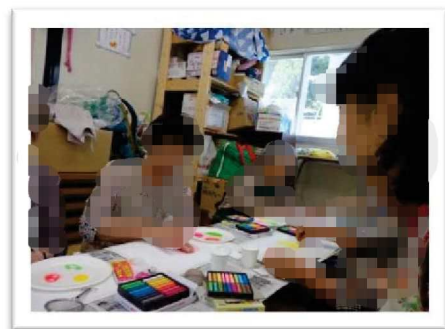
好きな色を選び無心で画用紙にクルクルパステルアート