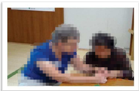
刺繍糸でミサンガ作り

また、嫌な梅雨の時期に入りますので散歩や畑仕事が出来ないときには、談話室に来てたくさんお喋りを楽しんで下さいネ!!