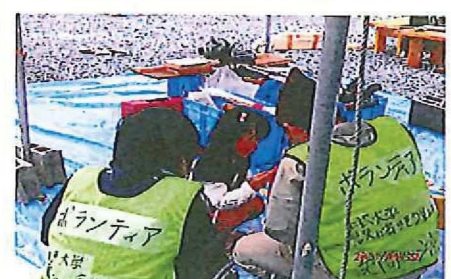
お手伝い エライですね