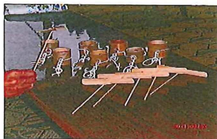
竹とんぼもあるよ