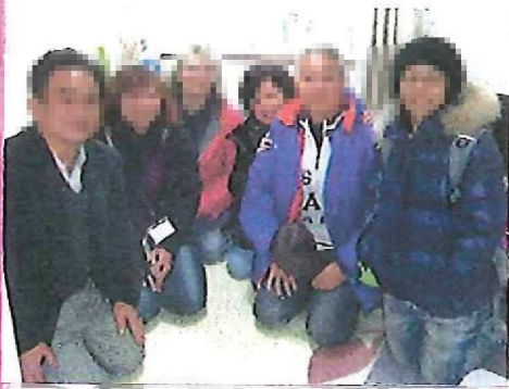
みなさんから、クリスマスツリーのプレゼントです★