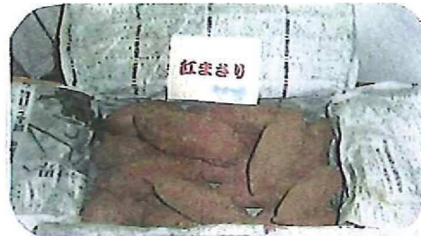
埼玉県 川越市から さつまいも 10kgです！ 立派なおいもですね〜