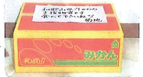
甘くて美味しい と評判でした 缶