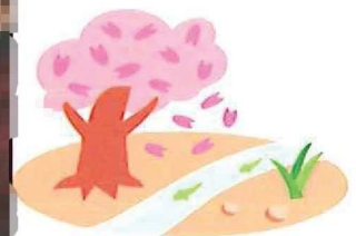
いきいきサロン（3月27日）