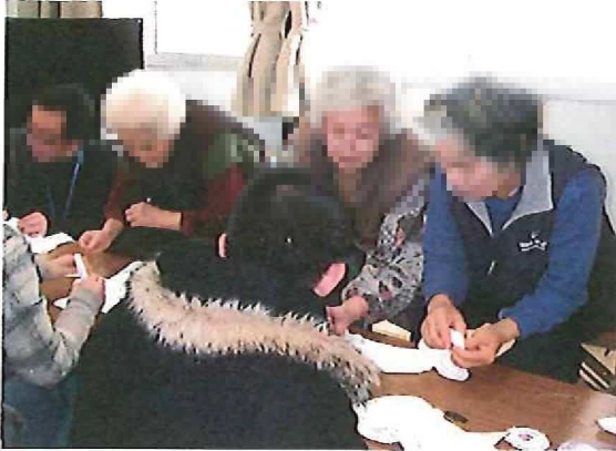
まけないぞうタオルの製作