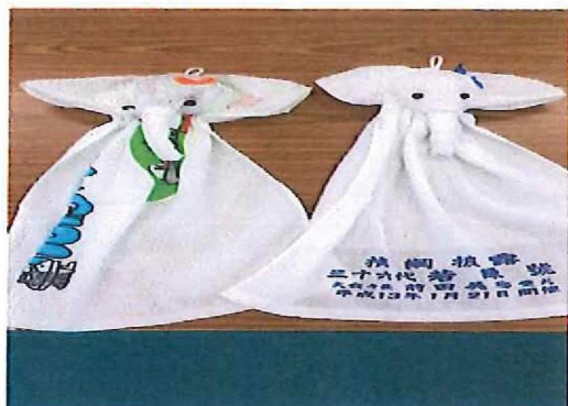
ぞうさんタオル作り