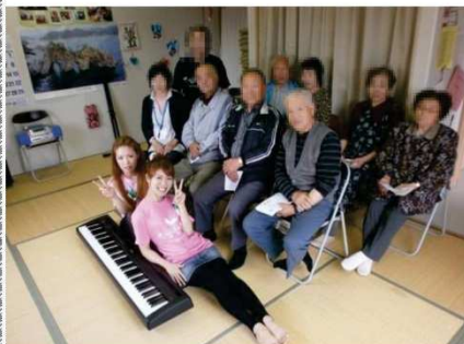
アソアソアソ (大根ソソアソ)