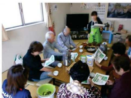
伊藤園おいしいお茶教室