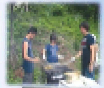
焼いてくれたスタッフ