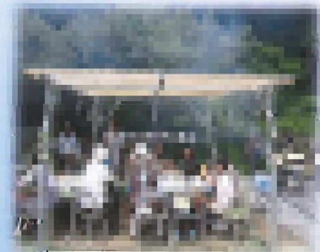
バーベキューの様子