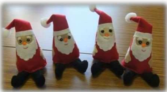
水原友の会 サンタクロース作り