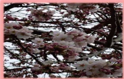
風花が舞ってるよ～