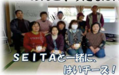
SEITAと一緒に、 はいチーズ!