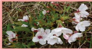
めんこく 咲きました。