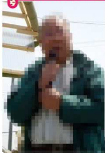
自治会長あいさつ