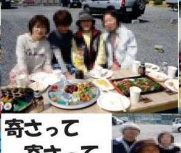
寄さって 寄さって